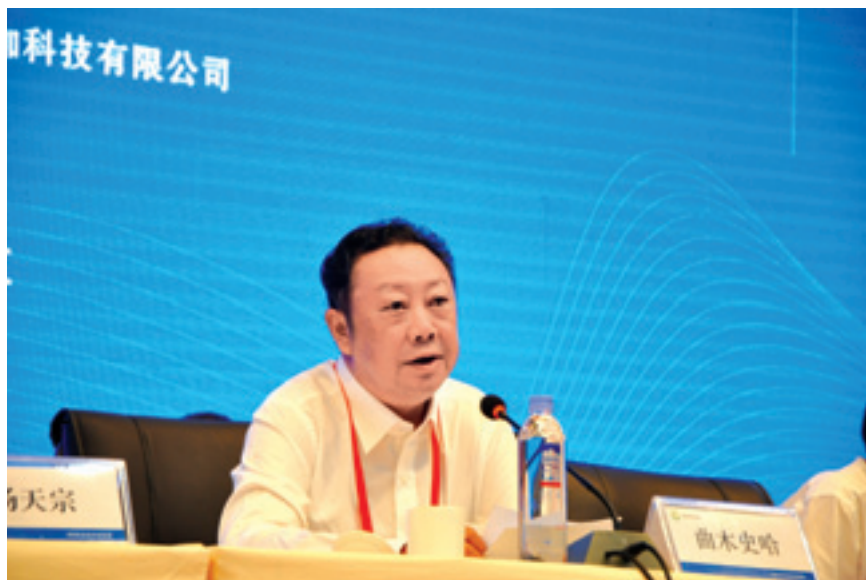
▲ 省委常委、省委农工委书记曲木史哈出席论坛开幕式并作重要讲话。

2017年9月22日-23日，首届四川村长论坛暨村社发展大会在成都市郫都区唐昌镇战旗村隆重举行，这是全国第一个省级层面的村长论坛，也是全省首次大规模召开的促进村级发展的工作推进会。省委常委、省委农工委书记曲木史哈出席论坛暨大会并作重要讲话。省委副秘书长、省依法治省办主任杨天宗主持论坛暨大会。全省省直相关部门领导，市（州）、县（市、区）党委或政府分管领导，四川百强名村及集体经济十强村负责人等450余人参加了会议。