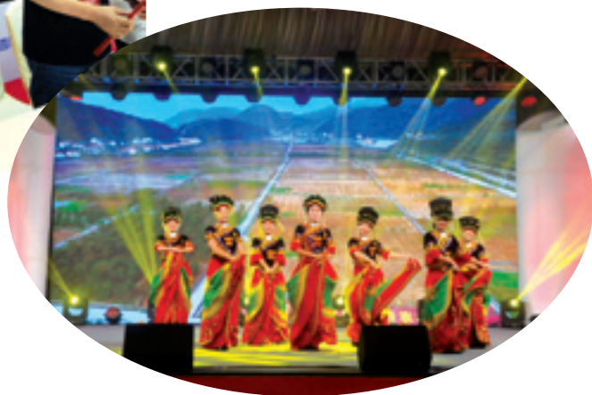
▲ 极具乡土气息和民族文化特色的“大美四川·百强名村”农民故事汇。