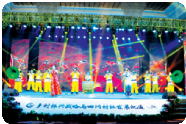
▲ 四川乡村非物质文化遗产展示节目表演。