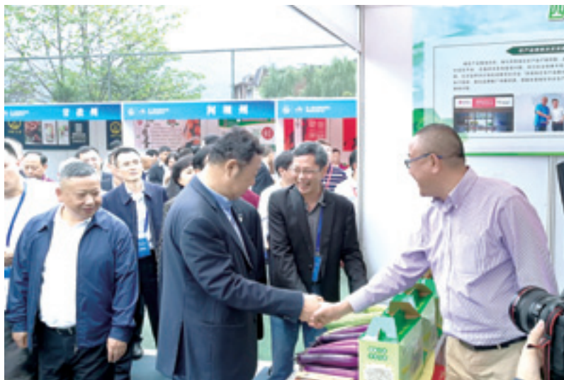
▲ 2018年9月18日，秘书处组织贫困地区龙头企业特色产品参加在洪雅县七里村举办的四川深度贫困地区（三州）和眉山市特色农产品展示活动，省委常委曲木史哈对秘书处推动城乡产销对接模式予以充分肯定。