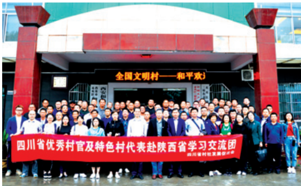
▲ 2019年4月中旬，组织四川省优秀村官及特色村代表赴陕西省学习交流，先后深入和平村、袁家村、白村、东岭村、新集村、西何社区等陕西名村以及杨凌农业高新技术产业示范区实地考察，并与当地村官、村级集体经济领头人座谈交流。

四川省村社发展促进会将始终抓住乡村振兴和村社发展的热点问题、焦点问题、难点问题，开拓思路，强化作风，提高效率，进一步强化平台建设，以机制建设为保障，以服务提升为重点，以资源聚合为支撑，扎实推进各项工作，为促进我省乡村全面振兴做出积极贡献，为推动四川由农业大省向农业强省跨越再立新功！