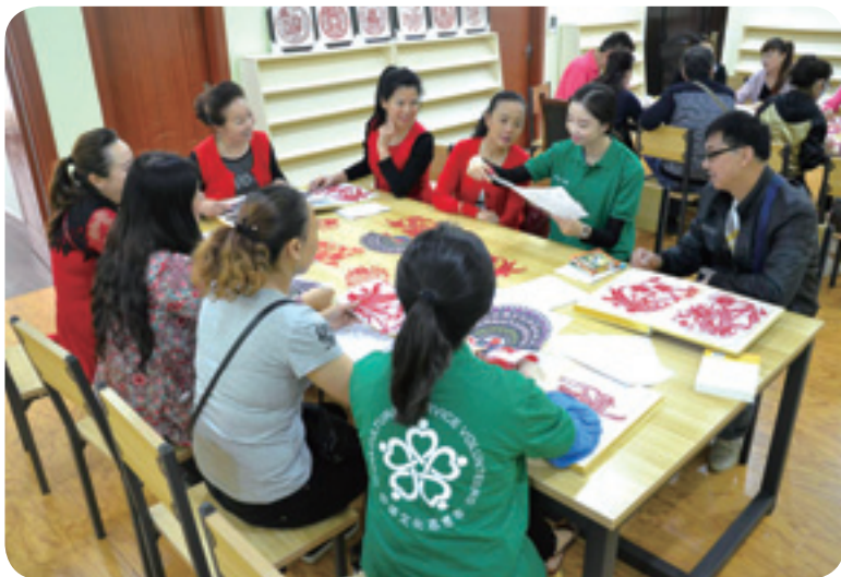
▲ 志愿者指导剪纸活动。

制度机制不断完善。坚持在“树”字上下功夫，持续开展“感恩自强、争先脱贫”“自力更生、共建家园”“文明和谐、共同奔康”“传承家风、树立家规”四