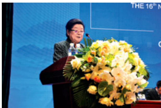
▲ 全国人大常委会原副委员长顾秀莲讲话。