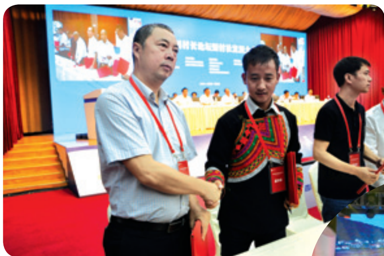
◀ 四川强村名村结对帮扶贫困村签约仪式。

据了解，本届论坛不仅是四川首次全省“村长”聚集一起共同研讨乡村发展治理的盛会，也是贯彻中央和省委要求，围绕推进农业供给侧改革、乡村治理，为推动乡村大发展、农业大提升，吹响新的发展号角，受到了社会各界的广泛关注。