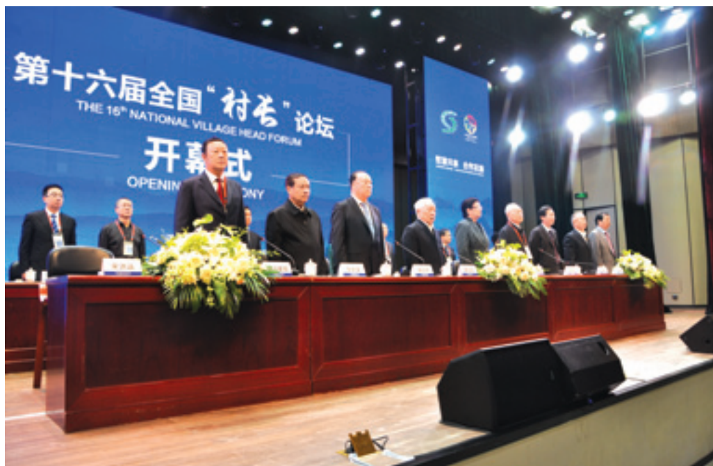
▲ 开幕式上全体起立，奏国歌。

2016年9月24—25日，第十六届全国“村长”论坛，在“全国百强村”“四川第一村”——彭州市龙门山镇宝山村隆重举行。这是全国“村长”论坛首次落户四川。