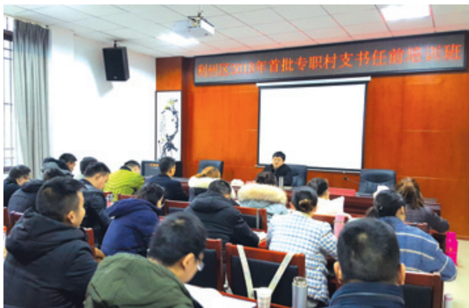
▲ 利州区首批专职村支书任前培训。

近年来，利州区坚定贯彻新时代党的组织路线，坚持大抓基层、大抓落实导向，全面提升农村基层党建质量，有力推动巩固脱贫成效与实施乡村振兴战略有机衔接、相融互促，乡村振兴实现良好开局。2018年，累计投入资金5.82亿元，高质量建设党建引领乡村振兴示范带4个，月坝村获登“中国十大乡村振兴示范村”榜单，并成功申办第三届四川村长论坛。