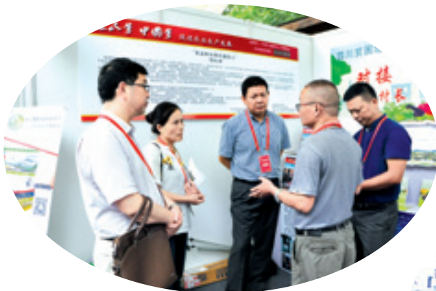
▲ 与会代表在名村项目对接暨特色农产品品鉴活动现场咨询四川省村促会组织的贫困地区农副产品产销对接活动。