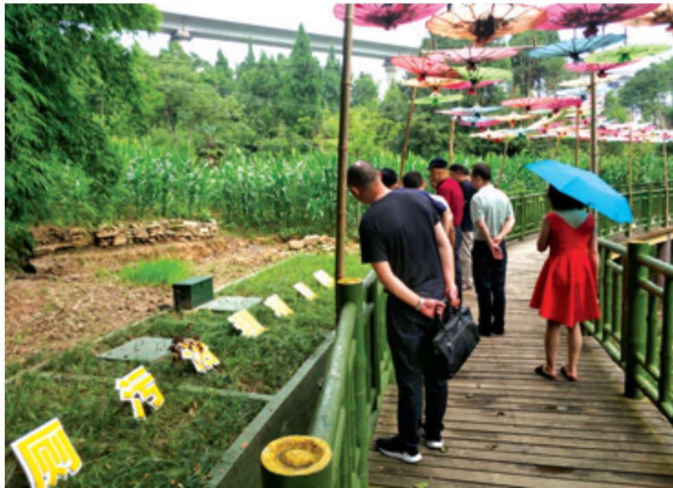
▲ 赤化镇泥窝社区三格式化粪池处理设施。

近年来，利州区以问题为导向，构建农村人居环境整治“1+1+5”的体制机制，累计实施农村危旧房改造5970余户，建成污水处理厂（站）、大型化粪池、沼气池50余处，户用沼气池1.1万口，安装一体化污水处理罐200余户，新建改造污水管网93.7千米，新（改）建农村公厕170余座，实施户用卫生厕所改造2万余户。使全区各类村级生活垃圾分类收集站点达到1792个，村用分类垃圾收集容器达到7897个，基本实现了农村生活污水、垃圾无害化处理和资源化利用，农村人居环境得到显著提升。