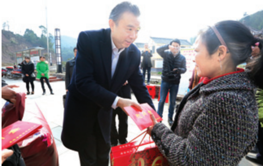
▲ 五粮液集团公司党委书记、董事长李曙光看望慰问兴文县毛村贫困群众。

三是发挥管理优势，助力脱贫。充分发挥大型国有企业在管理、经营等方面的优势，牵头筹建甘孜州首个村集体资产经营管理有限公司（理塘县上马岩村集体资产公司），并整合900万元资金打造五粮液理塘上马岩香菇示范基地，让资源变资产、资金变股金，农民变股东，项目完工后可为贫困户提供60余个就业岗位，实现人均增收36000元/年；根据兴文县贫困地区留守妇女多、就业机