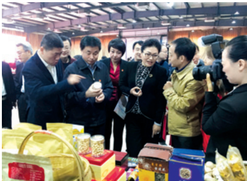
▲ 中国电信对口扶贫县农副产品体验展。

天虎云商是中国电信四川公司重点打造的全国综合性电子商务信息化平台。自2014年8月4日正式上线以来，天虎云商便以立足四川、面向全国，响应一带一路倡议的态势，积极构建“网上丝绸之路”。目前，已形成强大的互联网、云计算、数据服务等电子商务能力，注册用户已突破1800万户，覆盖31个省市自治区，产品实现全品类构建，覆盖国内及16个国家。同时，通过国际广泛合作，建设了“韩国馆、澳洲馆、欧美馆”等跨境电商供应体系，以及中国电信精准扶贫馆为代表的特色农产品供应体系。