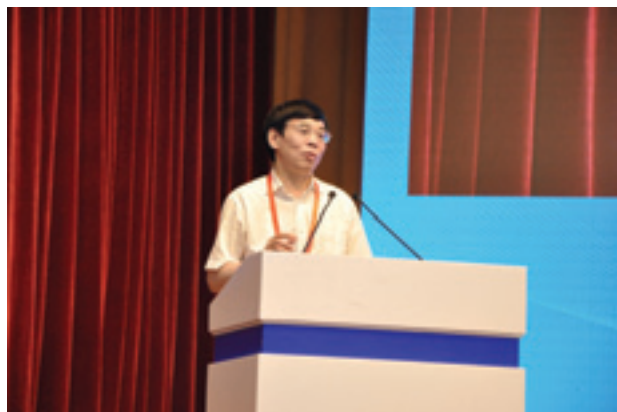
▲ 中国村社发展促进会副会长兼秘书长、农业部农村经济研究中心主任宋洪远作主题报告。

本届论坛先后进行了成都市郫都区村社发展现场点参观、“大美四川·百强名村”农民故事汇、首届四川村长论坛暨村社发展大会（以下简称“论坛大会”）、四川村社发展报告会、四川名村项目推介暨特色农产品品鉴活动、首届四川村长论坛闭幕式等内容丰富、形式多样的活动项目。