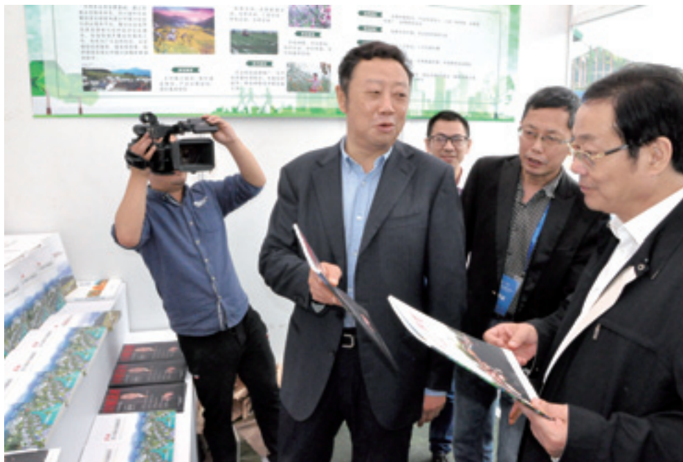
▲ 省委常委曲木史哈、省人大常委会副主任侯晓春对村促会编印的会刊杂志、发展报告、文献图书予以充分肯定。