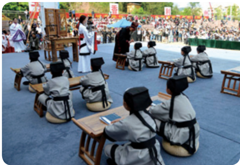
▲ 利州区第四届读书节。

保护传统文化与传承。积极编制完成全区乡村文化振兴规划和“四古”保护规划，切实加强乡村文化遗产保护，既守护好文物古迹、传统村落、古宅民居、古树名木等物质文化遗产，又守护好民间艺术、传统技艺、民俗表演等非物质文化遗产，让乡村文化更多一点“泥土的芬芳、时光的味道”，成为人们乡愁的寄托。积极抓好四川省十大历史名人武则天传承创新工程。加强非遗项目普查、申报工作，支持建立白花石刻、云峰剪纸等非遗传习所和展览馆，强化非遗传承队伍培养和品牌培育。深入实施农耕文化保护传承工程，对农耕文明所孕育并长期存续于乡村社会的价值理念、人文精神、伦理规范以及生产生活方式，进行创造性转化和创新性发展，努力让有形的乡村文化留得住，活态乡土文化传下去。