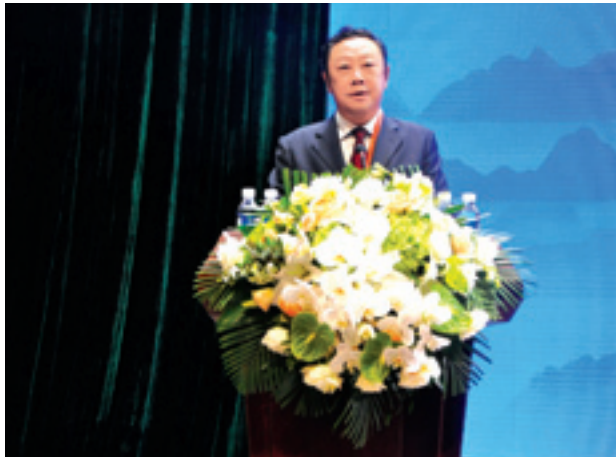
▲ 省委常委、省委农工委主任曲木史哈致辞。

共产党员、全国人大代表、全国党代表中有影响力的村官，以及55个少数民族村的村官代表、大学生村官代表将与全体参会村官一起探讨和交流。