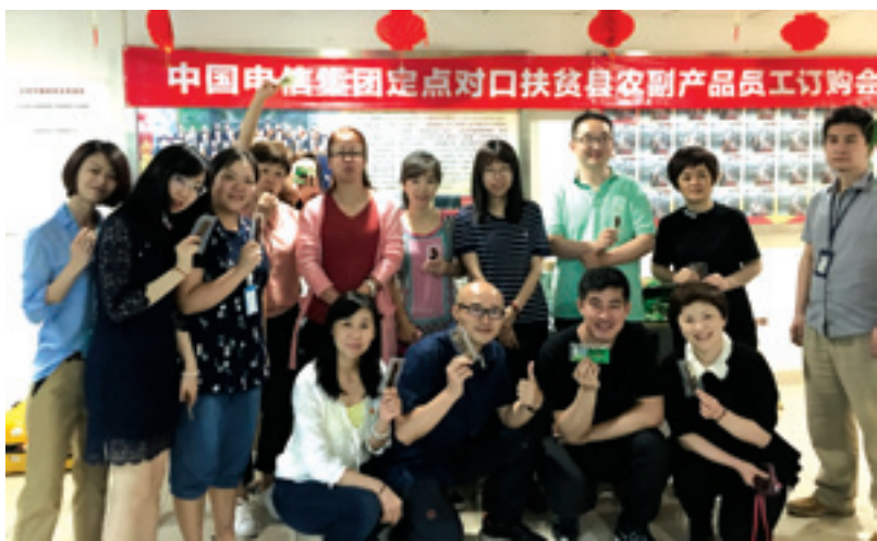
▲ 中国电信北京公司定点扶贫县员工以购代捐。

2018年至今，中国电信精准扶贫专馆农产品销售额超过3000万元，天虎云商扶贫案例引起社会媒体广泛关注。