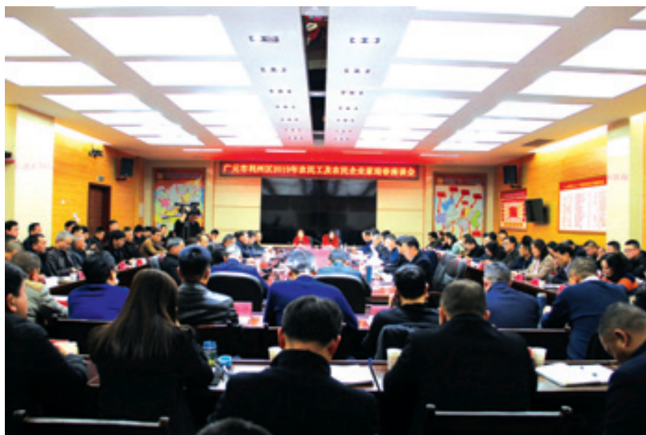
▲ 2019年全区农民工及农民企业家迎春座谈会。

“好戏要靠唱戏人，兴村就要先兴人”。广元市利州区委深入贯彻落实习近平总书记关于“乡村振兴，人才是关键”的重要指示精神，深入推进人才体制机制改革，大力实施重大人才工程，充分激发基层一线人才的干事创业激情，切实推动各类优秀人才在农村广阔天地展才华、显身手，助推乡村振兴实现良好开局。