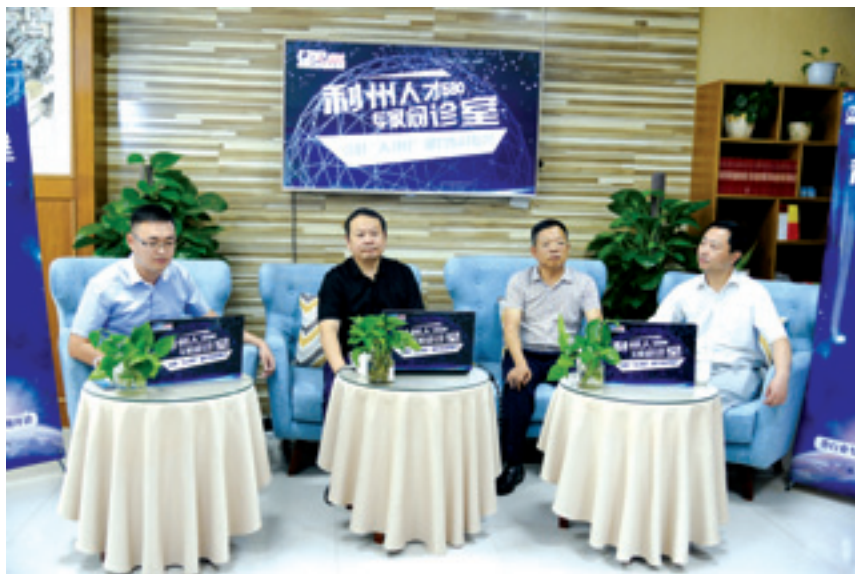
▲ 利州人才580专家问诊。

着眼激发各类人才干事创业激情，努力让愿意留在乡村的人留得安心，让愿意在农村干事的人更有信心。一是强化组织保障。充分发挥区人才工作领导小组牵头抓总作用，建立区、乡、村“三级联动”的人才工作机制；将人才工作纳入目标考核、抓党建述职的重要内容，推动党管人才责任落到实处。二是优化人才环境。强化经费保障，2018年共投入人才工作经费6300余万元，机关事业单位在职人员就读研究生学费全额报销。促进人才向基层流动，26名引进高层次人才到乡村振兴一线“蹲苗”培养。强化政治引领、政治吸纳，15名优秀人才得到提拔重用，117人发展为中共党员，65人纳入村“两委”后备干部人选，125人被推选为市、区“两代表一委员”，83人被评为市区两级科技拔尖人才、行业名人。三是注重人文关怀。落实好县级领导联系专家人才机制，29名县级干部与区内33名优秀农业人才“结对”。为高层次人才举办青年联谊会和集体婚礼，畅通优秀人才子女入学、落户办理等“绿色通道”。30名乡村振兴一线名人入选《乡村振兴领跑者—利州名人（二）》，70余名基层一线人才事迹在《人力资源报》《广元日报》、利州人才580服务平台等宣传报道，切实营造“尊才、爱才、惜才”的浓厚氛围。