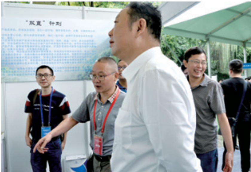
▲ 省委常委、省委农工委主任曲木史哈巡视特色农产品品鉴会活动，并高度评价村促会秘书处组织实施的城乡联动农产品直采直销计划。

据悉，按照首届四川村长论坛活动安排，进一步促进和帮助贫困村加快脱贫摘帽，8月29日，省委农工委召开了“携手共进、脱贫奔康”四川名村强村结对帮扶贫困村工作座谈会。本年度评选出的部分四川名村强村，以及扶贫任务较重市（州）的部分贫困村负责人参加座谈会。省