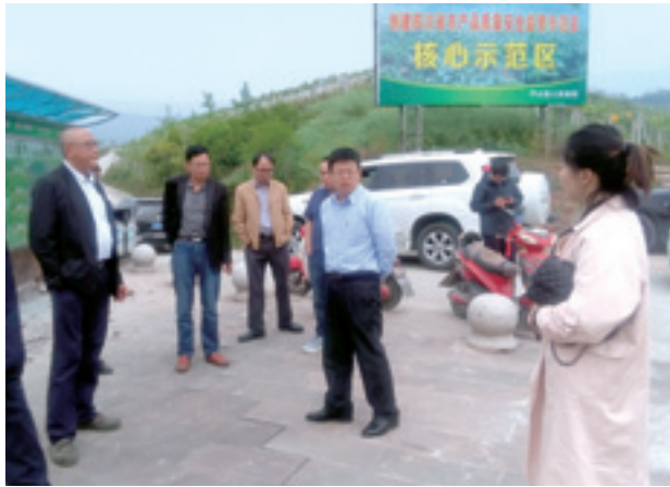
▲ 秘书处组织成都企业家赴芦山县考察特色产业发展情况。

总书记对四川工作系列重要指示精神，始终按照党中央、国务院和省委、省政府关于实施乡村振兴战略的决策部署要求，凝心聚力、求真务实，紧紧围绕乡村五大振兴目标和村社发展事业创新推动各项工作，组织建设不断夯实，调研成果不断显现，交流合作不断延伸，服务能力不断提升，平台功能不断完善，主题活动不断创新，社会影响不断扩大，取得了可喜的成绩