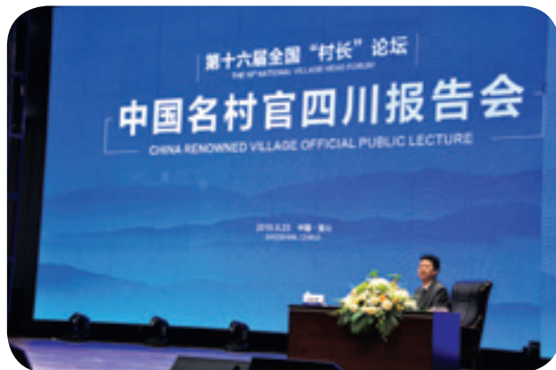
▲ 中国名村官四川报告会。