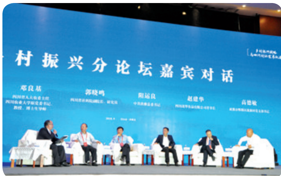
▲ 乡村振兴分论坛嘉宾对话。

论必作，作必成。“本次论坛内容丰富、含金量高，特别是四川以促进村社发展为基础，探索形成的一些特色村发展模式和典型经验，为全国各地实施乡村振兴战略提供了具有重要启示意义的四川方案。”农业农村部农村经济研究中心主任宋洪远认为。