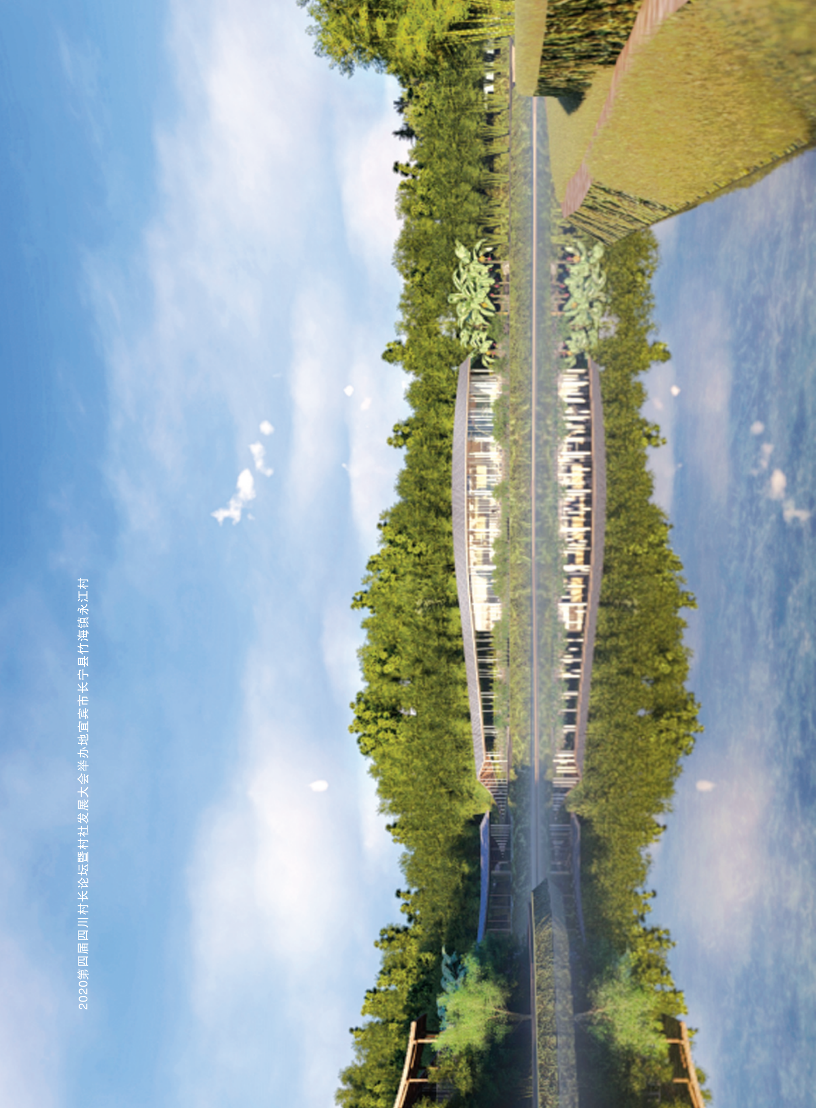
2020第四届四川村长论坛暨村社发展大会举办地宜宾市长宁县竹海镇永江村