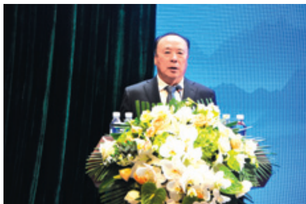
▲ 全国政协原副主席白立忱宣布论坛开幕。

目标，按照“创新、协调、绿色、开放、共享”的发展理念，以“智慧共享，合作发展”为主题，为来自全国各地的村官代表提供学习、交流、合作、投资的平台。在为期两天的时间里，与会代表将参加“村庄发展与精准扶贫、村庄投资、智慧村庄峰会”等交流，近距离了解宝山村从创业到转型创新的“宝山之路”，感受宝山人“领秀天府、幸福宝山”的追求与情怀。全国劳动模范、全国优秀