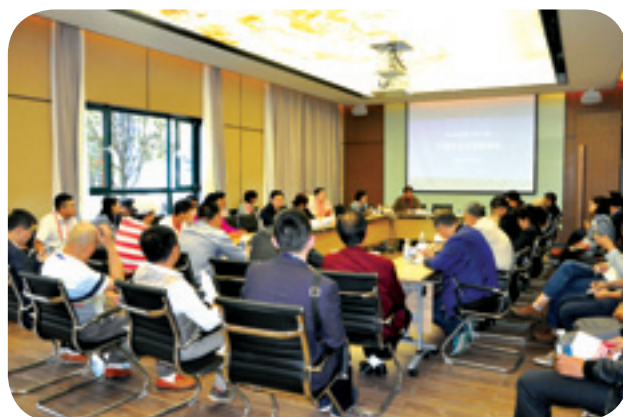
▲ 中国农业公园研讨会。