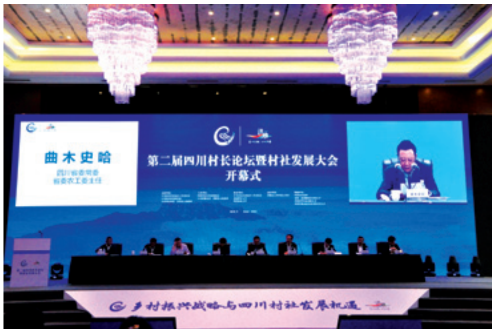
▲ 省委常委、省委农工委主任曲木史哈出席论坛开幕式并作重要讲话。

2018年9月17日至18日，第二届四川村长论坛暨村社发展大会在眉山市洪雅县七里坪隆重召开。省委常委、农工委主任曲木史哈出席论坛暨大会并作重要讲话，省人大常委会副主任侯晓春、省政协副主席祝春秀出席论坛。省委农工委常务副主任、农业厅党组书记、厅长杨秀彬主持论坛开幕式。