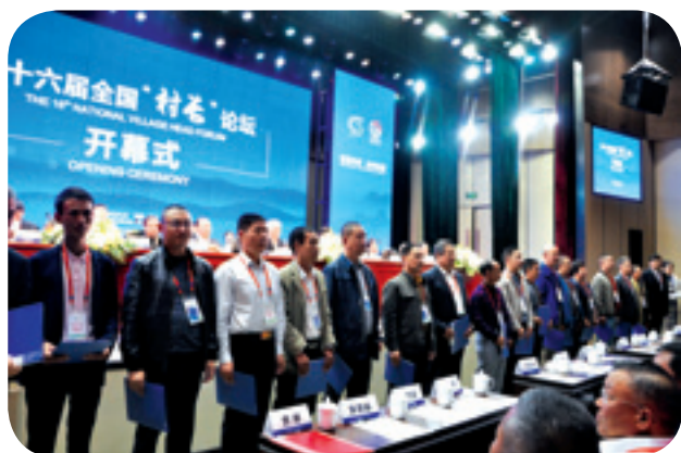
▲ 中国名村与四川贫困村结对帮扶协议交换仪式。