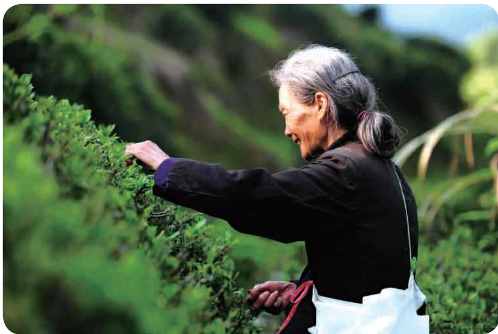
▲ 村民在茶园采茶务工。

2020年12月17日，省政府在广元召开全省推进返乡下乡创业工作暨表彰大会，黄革文被省农民工工作领导小组授予“四川省返乡下乡创业明星”荣誉称号。黄革文表示，将一如既往地自强不息、再创佳绩，积极履行社会责任，为造福乡梓、建设乡村作出新的更大贡献。