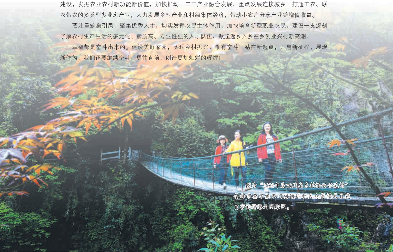
图为“2020年度四川省乡村振兴示范村” 什邡市蓉华镇石门村通过村民众筹模式自建 自营的神瀑沟风景区。

幸福都是奋斗出来的。建设美好家园，实现乡村振兴，惟有奋斗！站在新起点，开启新征程，展现新作为，我们还要继续奋斗，勇往直前，创造更加灿烂的辉煌！