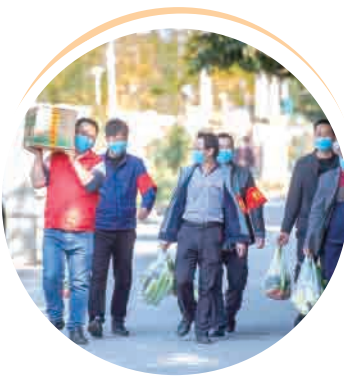
▲ 疫情防控志愿服务。