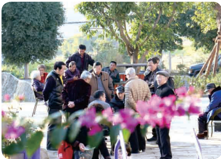
▲ 康养党员娱乐休闲。

2016年，贤家村引进四川老易养老服务服务有限公司，以“全权托管、加盟经营、联盟管理”模式，统一