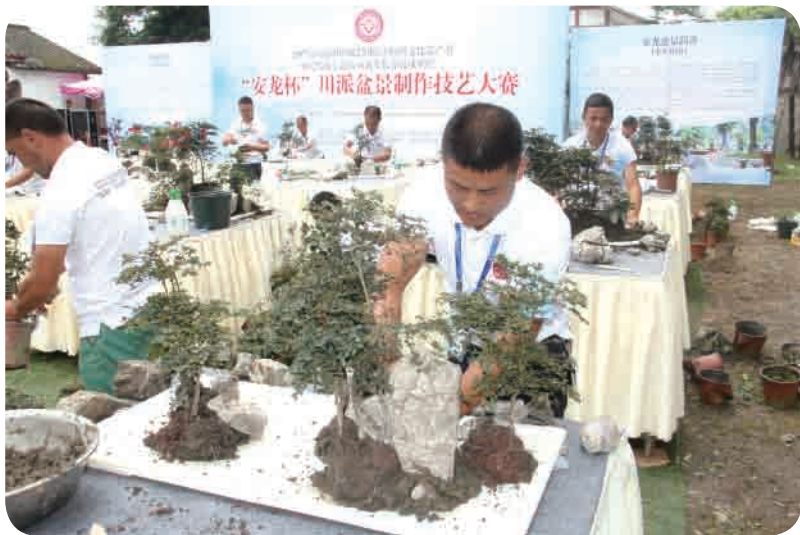
▲ 安龙镇举办“安龙杯”川派盆景制作技艺大赛。

三是产品结构二元分化。盆景按大小可分为大、中、小、微四种类型，据品质高低分为产品、作品、艺术品三个层次，总体来看，都江堰盆景产业呈现明显二元分化。占经营主体少数的46家精品盆景园主要从事大中型盆景