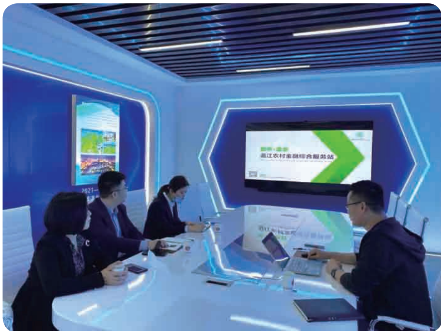
▲ 工商银行温江支行领导一行到温江区农村金融综合服务站进行交流考察。

成都购房节活动期间，成都15家县（区）域支行累计接待返乡务工客户650余人次，累计办理个人按揭贷款228笔。本次活动为成都地区春季返乡务工人员提供购房便捷优质服务，切实做到助农惠农。