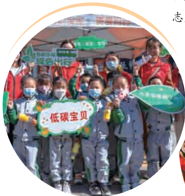
▲ 举办低碳出行活动。