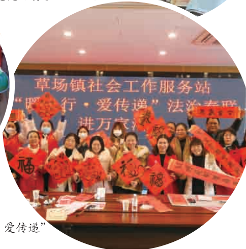
▶ 社会工作服务站“暖心行 爱传递” 法治春联进万家活动。