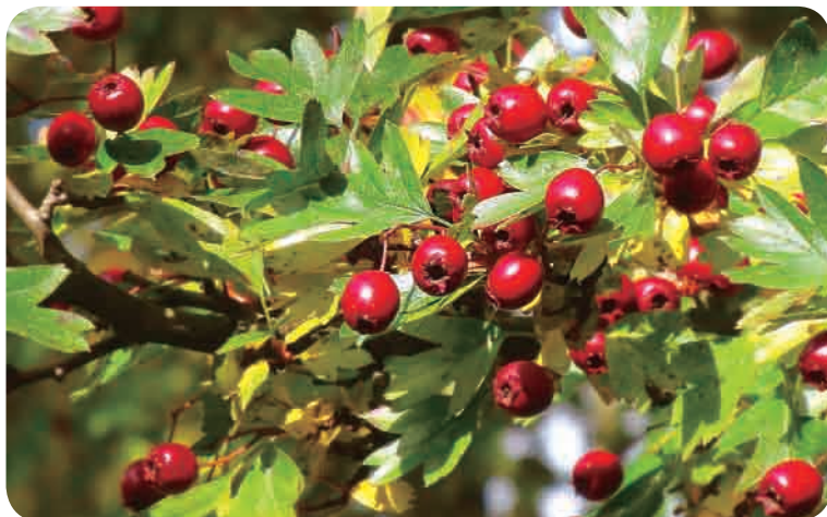
▲ 刘杜镇万亩山楂成为群众“致富果”。

乡村振兴，人才是关键。新泰市持续深化“育苗升级”工程，新选聘100名大学生到村任职，选派155名第一书记驻乡帮扶，源源不断为乡村振兴发展注入强劲动力。同时，致力建设红色引领型、绿色产业型等五大类、80处区域化党群服务中心，高标准高质量完成村（社区）两委换届、软弱涣散党组织整顿转化，刘杜镇北流泉村以党建引领乡村振兴的实践被确定为全省“乡村振兴齐鲁典型案例”。