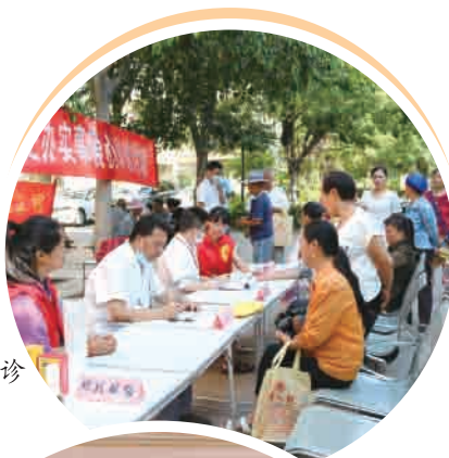
▶ 开展爱心义诊 志愿服务。

发展光伏清洁能源产业，推广低碳建筑，建设低碳民居100户，逐步调整村庄能源结构，着力推动农业农村绿色高质量发展和乡村全域全面振兴，全面展示米易县“产业强、生态优、人文美”的农业农村现代化建设新成效。