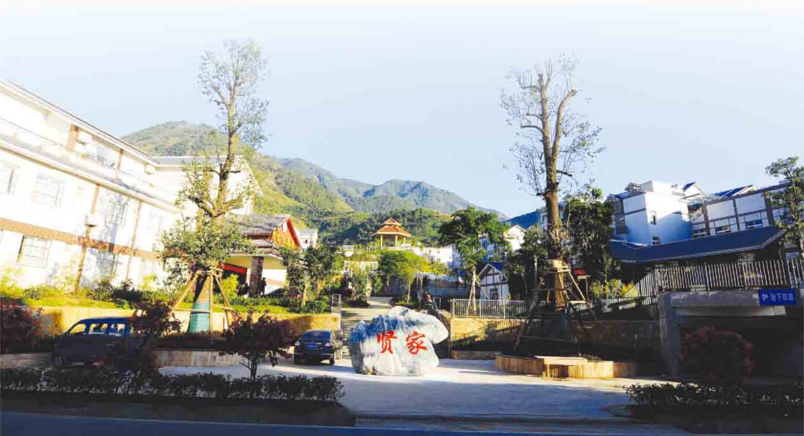
米易县攀莲镇贤家村