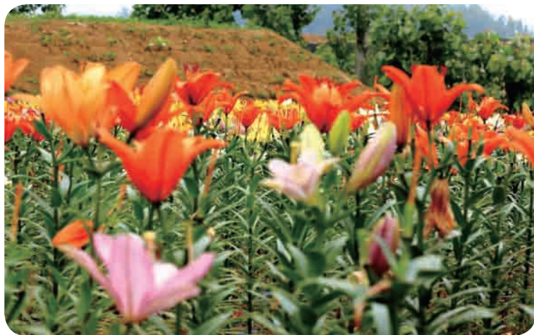
▲ 每年六月，羊流镇万亩百合盛开吸引众多游客。

目前，新泰市农村生活垃圾无害化处理率达到100%，投资1.39亿元实施农村饮水安全提升工程，农村道路、安全饮水基本实现“户户通”，美丽乡村示范村达到542个，100个后进村全部完成达标提升。从新甫山下到青云湖畔，从繁华城市到广袤乡村，一幅农业强、农村美、农民富的乡村振兴美好画卷正在新泰这片广阔的大地上徐徐展开。