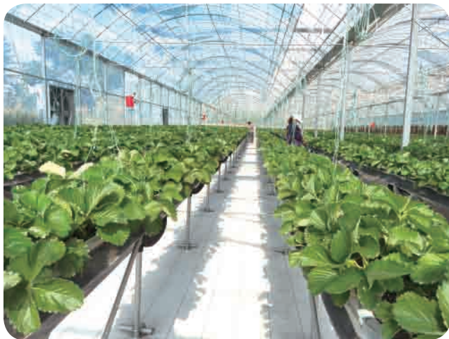
▲ 贤家村现代农业产业园。