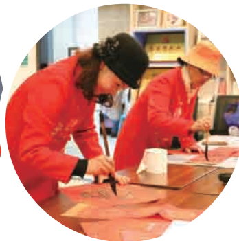
▲ 市民正在党群服务中心书画区 练习书画。