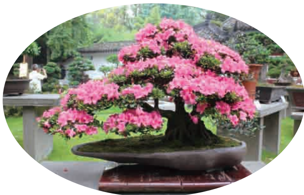
▲ 四川省“川派盆景展览”金奖