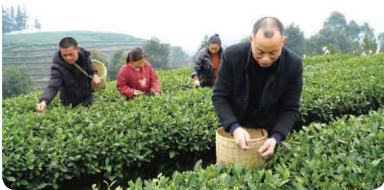
▲ 犍为县舞雩镇高龙村“峨眉问春”茶园开采。